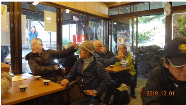
食堂で楽しく談笑

全員そろったところで、昼食の時間となり、お店に入り「養老うどん」や「養老そば」、みたらし団子などを注文し、料理を待つ間、よもやま話に花が咲きました。