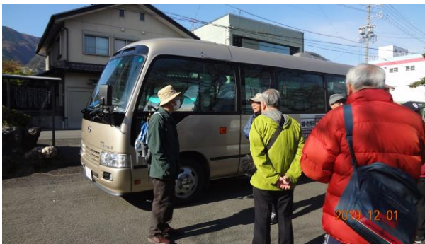
駅からすぐシャトルバスに乗る

定刻に集合した7名のうち6名が先発隊として出発、1名が遅刻組みを駅で待っていてくれました。さいわい駅から養老公園までシャトルバスが利用でき、さらに公園から養老の滝へ行く途中まで無料のカートで送ってもらいました。おかげで、滝から帰る先発組と途中で無事合流することが出来ました。