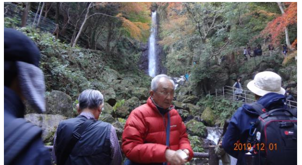
養老の滝の眺めをたのしむ

全員そろったところで、昼食の時間となり、お店に入り「養老うどん」や「養老そば」、みたらし団子などを注文し、料理を待つ間、よもやま話に花が咲きました。