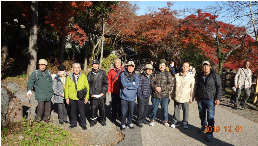
美しい紅葉をバックに集合写真を撮る

みやげ物店や飲食店が軒を連ねる「養老孝子坂」は紅葉を楽しむ行楽客で混雑していましたが、場所を見つけ、美しい紅葉をバックに集合写真を撮りました。