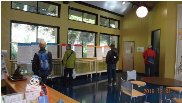
「孝子館」で知識を深める

途中、「孝子館」に立ち寄り、「孝子伝説」についての知識を深めました。養老公園の出口には丁度シャトルバスが待っていて、歩き疲れた3人が利用し、残り8名は駅まで歩くことになりました。