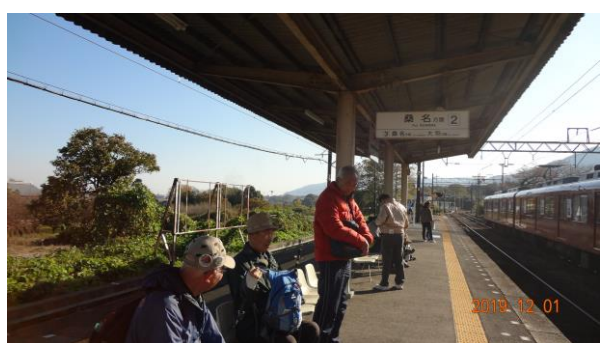
大垣経由組と桑名経由組に分かれる