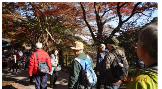
行楽客でにぎわう「養老孝子坂」を下る