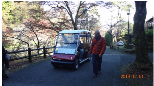
続いて、カートで送ってもらう