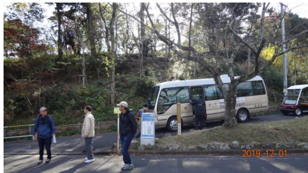
帰りも3人がシャトルバスを利用

養老駅には午後1時20分ごろに全員が無事到着し、各自が楽しい思い出をもって、大垣に向かうグループと、桑名に向かうグループに分かれて家路に着きました。