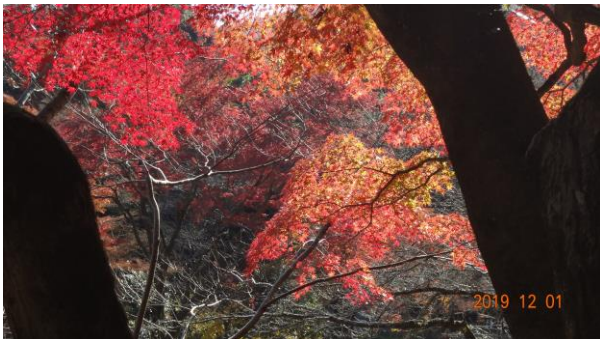
素晴らしい紅葉に出会う