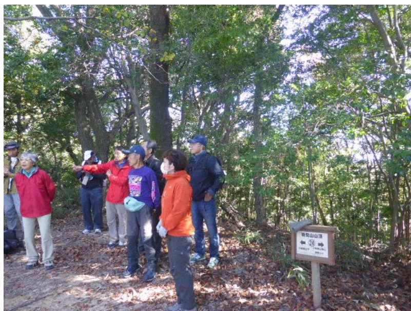
《物見山山頂からは名古屋駅周辺から養老の山並みまで見事な眺望だった!(^^)!》