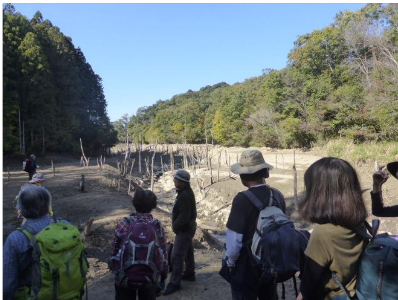
《大正池には水が無く、チョットがっかり》