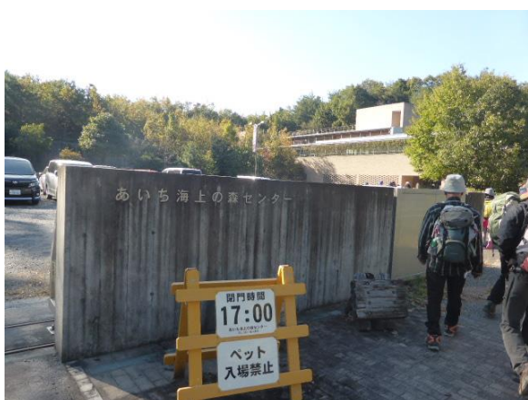
《あいち海上の森センターに到着：午後2時》