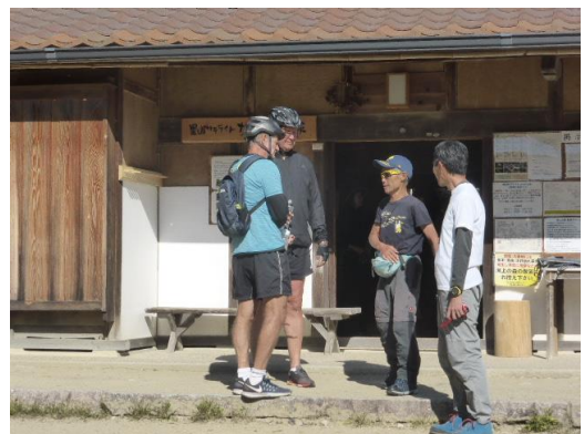
《山口駅から小1時間、里山サテライト到着（小休憩）：南アフリカからの青年と談笑》