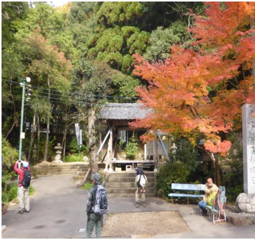
（伊吹の滝不動明王登山口）

◆ 天候 は風もなく気温14℃の小春日和。11月のハイキングにはうってつけの天気となりました。