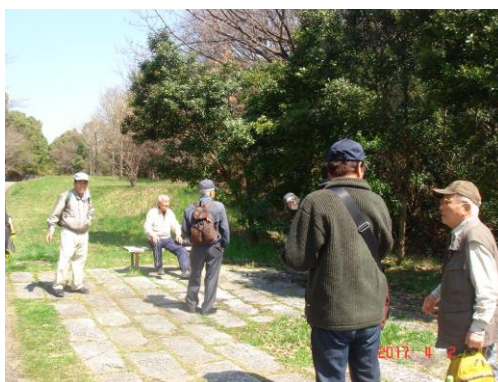
少し歩いて小休止

桜は残念ながらほとんど咲いていませんでしたが、園内をゆったりと散策しました。猫ヶ洞池手前で集合写真を撮り、コアラの餌となるユーカリの林を横に見ながら、園内を北上し、アクアタワー（平和公園給水塔）に至りました。