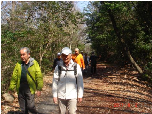
一万歩コースを歩き始める

4月2日、この地方としては少しはやめの桜見物を兼ねたウォーキングに平和公園に出かけました。地下鉄星ヶ丘駅に集合、急な坂を上りきったところで準備体操をし、平和公園一万歩コースに合流しました。