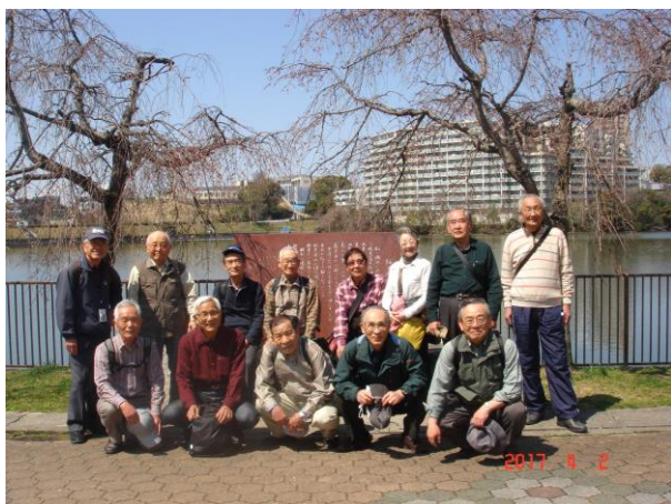
猫ヶ洞池で集合写真を撮る