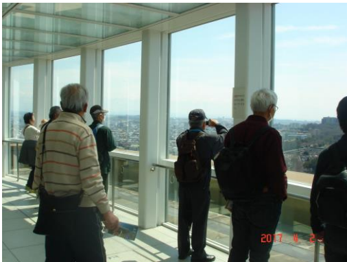
展望台で見晴らしを楽しむ