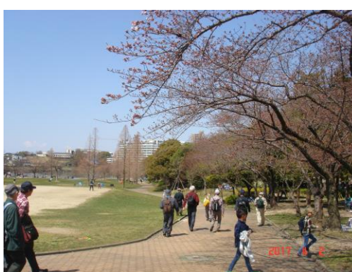
桜はほんのちらほら